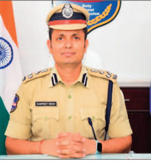
కమిషనరేట్ కార్యాలయంలోని ట్రాఫిక్ ట్రైనింగ్ సెంటర్ వాహనదారుల కుటుంబ సమక్షంలో కౌన్సిలింగ్ నిర్వహించిన అనంతరం కోర్టులో న్యాయమూర్తి ఎదుట పర్చడం ద్వారా వాహనదారులకు కోర్టులో జైలు శిక్ష లేదా జరిమానా విధించడం జరుగుతుందని వరంగల్ పోలీస్ కమిషనరేట్లో గత వారం ట్రైనిటి ట్రాఫిక్ పోలీసులు ముమ్మరంగా జరిపిన డ్రంక్ అండ్ డ్రైవ్ తనిఖీల్లో మొత్తం 368 కేసులు నమోదు కాగా, ఇందులో 19 మందికి

నేటి సాక్షి ఉమ్మడి వరంగల్ (సంఘం): మద్యం సేవించి వాహనం నడపడం ద్వారా గత వారంలో 19 మంది వాహన దారులు జైలు శిక్ష అనుభవించారని వరంగల్ పోలీస్ కమిషనర్ తెలిపారు. వానదారులు మద్యం సేవించి వాహనం నడపడం ద్వారా పట్టణంలోని, పరోక్షంగాని రోడ్డు ప్రమాదాలకు ప్రధాన కారకులు కావడంతో కొన్ని సందర్భాల్లో సదరు మద్యం సేవించి వాహనదారుడు సైతం రోడ్డు ప్రమాదాలకు గురై మృత్యువాత పడుతున్నారు. తద్వారా ఎన్నో కుటుంబాలు రోడ్డున పడుతున్నాయి. ఇది దృష్టిలో వుంచుకొని వరంగల్ పోలీస్ కమిషనరేట్ మద్యం సేవించి వాహనదారుల వలన కలిగే రోడ్డు ప్రమాదాల నివారణకై వరంగల్ పోలీస్ కమిషనరేట్ పరిధిలో ప్రత్యేక చర్యలు తీసుకోవడం జరుగుతోంది. ఇందులో భాగంగా వరంగల్ ట్రైనిటి పరిధిలో ట్రాఫిక్ మరియు లా అండ్ ఆర్డర్ పోలీసులు నిరంతరం డ్రంక్ అండ్ డ్రైవ్ తనిఖీలు చేపట్టడం జరుగుతుందని అలాగే గ్రామీణ ప్రాంతాల్లోని అన్ని పోలీస్ స్టేషన్ల పరిధిలో డ్రంక్ అండ్ డ్రైవ్ తనిఖీలు నిర్వహించబడుతున్నాయి. ప్రధానం వరంగల్ ట్రైని పరిధిలో ట్రాఫిక్ పోలీసులు చేపట్టే డ్రంక్ అండ్ డ్రైవ్ తనిఖీల్లో పట్టుబడిన వాహన దారులకు ముందుగా కమిషనరేట్ కార్యాలయంలోని ట్రాఫిక్ ట్రైనింగ్ సెంటర్ వాహనదారుల కుటుంబ సమక్షంలో కౌన్సిలింగ్ నిర్వహించిన అనంతరం కోర్టులో న్యాయమూర్తి ఎదుట పర్చడం ద్వారా వాహనదారులకు కోర్టులో జైలు శిక్ష లేదా జరిమానా విధించడం జరుగుతుందని వరంగల్ పోలీస్ కమిషనరేట్లో గత వారం ట్రైనిటి ట్రాఫిక్ పోలీసులు ముమ్మరంగా జరిపిన డ్రంక్ అండ్ డ్రైవ్ తనిఖీల్లో మొత్తం 368 కేసులు నమోదు కాగా, ఇందులో 19 మందికి