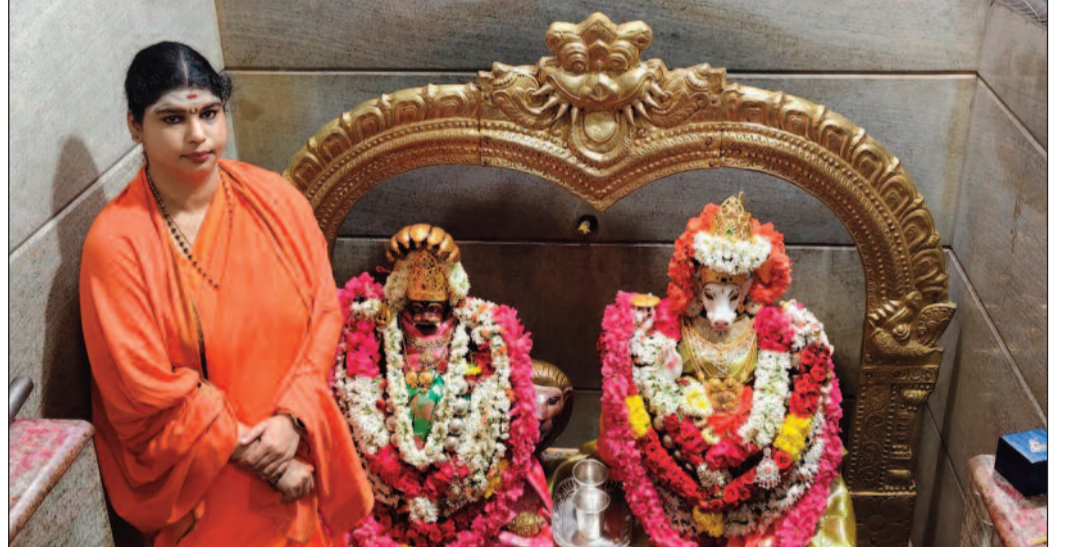
వితరణ చేశారు ఈ ఉత్సవాలు వేడుకగా అధిక సంఖ్యలో భక్తులు పాల్గొన్నారు