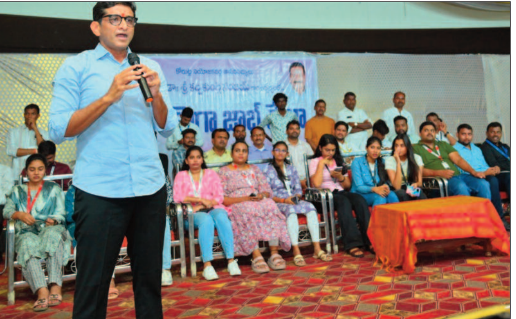
సాధించిందన్నారు. భారతదేశం అభివృద్ధి చెందుతున్న దేశం గానే మిగిలిపోయిందని పేర్కొన్నారు. అంతర్జాతీయ స్థాయిలో భారతదేశం అభివృద్ధి చెందాలంటే మహిళలు మెర్సెస్, వైజ్జానిక, ఉద్యోగ రంగాల్లో రాణించాలన్నారు. జూబ్ మేళాలో ఏ ఉద్యోగం సాధించిన జాయిస్ కావాలని, హైదరాబాద్లో మహిళలకు ఏ అవసరం ఉన్న తనను సంప్రదించాలని సాయం అందించేందుకు ఎల్లవేళలా అందుబాటులో ఉంటానని ఎమ్మెల్యే సంజయ్ హామీ ఇచ్చారు. తొలిమెట్టు నుంచే మరీ మెట్టుకు చేరుకుంటామని, ఉన్నత ఉద్యోగంలో స్థిరపడేందుకు ఉద్యోగ అనుభవం దోహదం చేస్తుందని తెలిపారు. 75 కంపెనీలకు చెందిన ప్రతినిధులు ప్రత్యేకంగా స్టాల్స్ ఏర్పాటు చేసి కేటగిరీలవారి నిరుద్యోగ యువతకు ఇంటర్వ్యూలు నిర్వహించి ఐటీ, ఫార్మా, ఫైనాన్స్, బ్యాంకింగ్ రంగాలకు చెందిన కంపెనీలు జూబ్ మేళాలో పాలుపంచుకున్నాయి.

నేటి సాక్షి - కోరుట్ల (రాధారావు నర్సయ్య): నవతరం, యు-వతరం చేతుల్లోనే దేశ భవిష్యత్ ఉంది.. కోరుట్ల ఎమ్మెల్యే డాక్టర్ కల్యాణకుంట్ల సంజయ్ అన్నారు. ఆడవాళ్లు మగవాళ్లు అనే బేధం లేకుండా ప్రతి ఒక్కరు తమ ప్రతిభను చాటుకొని ఉద్యోగాల్లో రాణించాలని ఎమ్మెల్యే డాక్టర్ సంజయ్ పేర్కొన్నారు. కోరుట్ల లోని కలకం సంగయ్య ఫంక్షన్ హాల్ లో జూబ్ మేళా ద్వారా 556 మంది కోరుట్ల యువతకు కోరుట్ల ఎమ్మెల్యే డా.కల్యాణకుంట్ల సంజయ్ ఉద్యోగ అవకాశాలు కల్పించారు. పట్టణంలోని కల్పా సంగయ్య ఫంక్షన్ హాల్లో కోరుట్ల ఎమ్మెల్యే డాక్టర్ సంజయ్ ఆధ్వర్యంలో ఏర్పాటుచేసిన మేళా జూబ్ మేళా లో 1756 మంది విద్యార్థులు పాల్గొన్నారు. ఈ మేళా జూబ్ మేళా ద్వారా 556 యువతకు ఉపాధి కల్పించారు. తెలంగాణలో యు-వతరం గళం ఎత్తితేనే ప్రత్యేక తెలంగాణ రాష్ట్రం సిద్ధించిందని పేర్కొన్నారు. కొత్త తరం తెలంగాణ రాష్ట్రాన్ని దేశంలోనే కాకుండా అంతర్జాతీయ స్థాయిలో పేరు ప్రఖ్యాతలు గడించేలా ముందుకు తీసుకెళ్లవలసిన అవసరం ఉందన్నారు. యువత తలుచుకుంటే సాధించలేదని ఏమీ లేదని తమ నిట్టే ను ఉపయోగించి దేశ పునర్నిర్మాణానికి అవసరమైన మేధానంపత్రిని పెంపొందించుకోవాలని పేర్కొన్నారు. జూబ్ ప్రొఫైల్స్ రోజురోజుకు మారిపోతున్నాయని కృత్రిమ మేధస్సు ద్వారా సరికొత్త ప్రపంచం ఆవిష్కరణం కానుందని తెలిపారు. 30 ఏళ్ల క్రితం చైనా, ఇండియా స్థూల ఉత్పత్తిలో తలసరి ఆదాయంలో సరి సమానంగా ఉండేవన్నారు. కాలక్రమమైన చైనా అభివృద్ధి చెందిన దేశంగా వృద్ధి