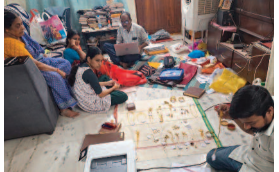
వివరాలు 2వ పేజీలో