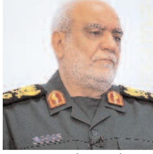
ఒక ప్రకటన విడుదల చేసింది. ఇది నేరపూరిత ఉగ్రవాద దాడి అని, ఈ దాడిలో ఖదేమీ 'షహీద్' (అమరుడు) అయ్యారని పేర్కొంది. అయితే, దాడి ఎక్కడ

టెహ్రాన్/వాషింగ్టన్, ఏప్రిల్ 6: పశ్చిమాసియాలో ఉద్రిక్తతలు మరింత తీవ్రమయ్యాయి. ఇరాన్ కు మరో భారీ ఎదురుదెబ్బ తగిలింది. అమెరికా, ఇజ్రాయిల్ దళాలు సంయుక్తంగా జరిపిన వైమానిక దాడిలో ఇస్లామిక్ రెవల్యూషనరీ గార్డ్ కార్పొ (ఐఆర్ జిసీ) ఇంటెలిజెన్స్ చీఫ్, మేజర్ జనరల్ సయ్యద్ మజిద్ ఖదేమీ మరణించారు. సోమవారం తెల్లవారుజామున ఈ దాడి జరిగినట్లు ఇరాన్ ప్రభుత్వం అధికారికంగా ప్రకటించింది. ఈ ఘటనపై ఐఆర్ జిసీ