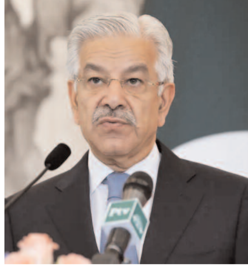
దాడులకు పాల్పడే అవకాశం ఉందని ఇంటెలిజెన్స్ సమాచారం అందింది. ఎన్నికల వాతావరణాన్ని చెడగొట్టడమే పాక్ ప్రధాన ఉద్దేశమని అధికారులు అనుమానిస్తున్నారు.

న్యూఢిల్లీ/కోల్ కతా, ఏప్రిల్ 6: భారత్ లో ఏదైనా 'ఫాల్స్ ఫాగ్ ఆపరేషన్' జరిగితే, దానికి ప్రతికారంగా కోల్ కతాను టార్గెట్ చేస్తామంటూ పాకిస్తాన్ రక్షణ మంత్రి ఖవాజా ఆసిఫ్ చేసిన వివాదాస్పద వ్యాఖ్యలు అంతర్జాతీయంగా కలకలం రేపుతున్నాయి. ఈ నేపథ్యంలో భారత భద్రతా ఏజెన్సీలు అత్యంత అప్రమత్తమయ్యాయి. పాక్ మంత్రి వ్యాఖ్యల వెనుక ఉన్న లోతైన కుట్రలను అధికారులు విశ్లేషిస్తున్నారు. పశ్చిమ బెంగాల్ లో ప్రస్తుతం జరుగుతున్న ఎన్నికల ప్రక్రియను దృష్టిలో ఉంచుకునే పాక్ మంత్రి కోల్ కతాను ప్రస్తావించారని నిఘా వర్గాలు భావిస్తున్నాయి. హరత్-ఉల్-జిహాద్ ఇస్లామీ (హుజీ), జమాత్-ఉల్-ముజాహిదీన్ బంగ్లాదేశ్ (జేఎంబీ) వంటి ఉగ్రవాద సంస్థలను రెచ్చగొట్టి, బెంగాల్ మరియు అసోం రాష్ట్రాల్లో