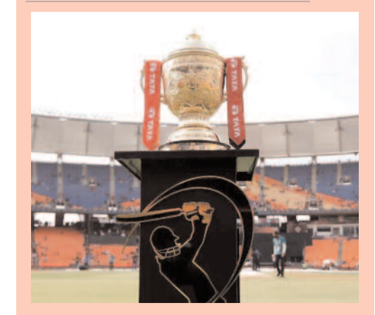
ఇదే ఐపీఎల్ ప్రత్యేకత అని చెప్పాలి.